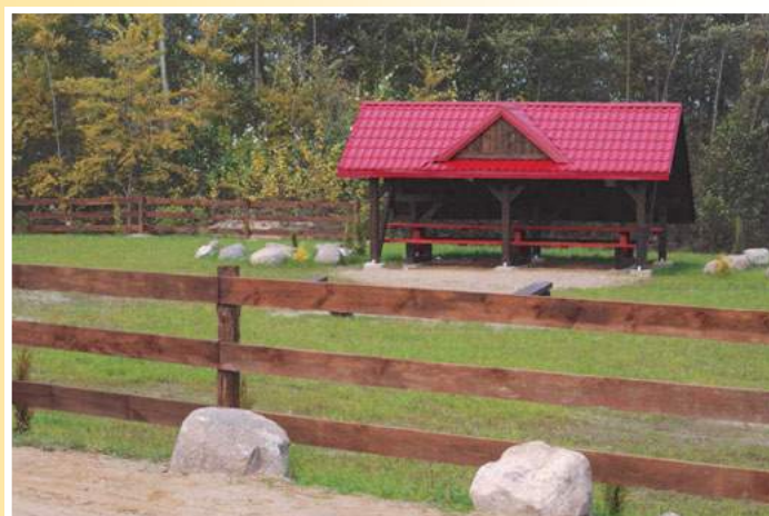
Teren rekreacyjny we wsi Pułazie Świerze