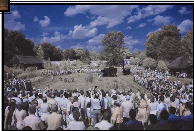
Wyróżnienie w konkursie „Krajobraz kulturowy wsi województwa podlaskiego” - rok 2013