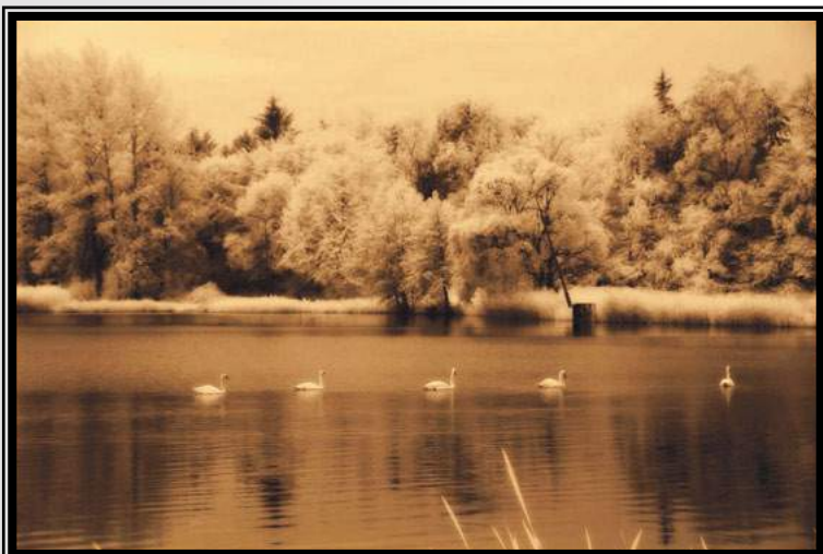
I miejsce w konkursie „Gmina wczoraj i dziś” gminy Wysokie Mazowieckie