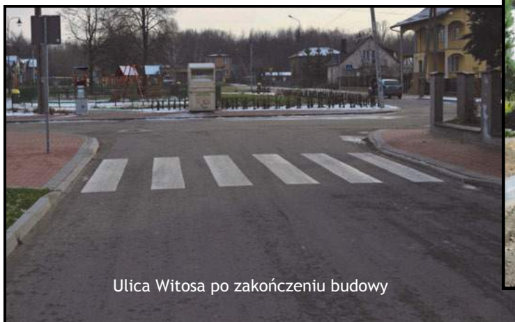
Ulica Witosa po zakończeniu budowy