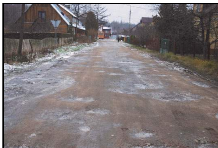
Fragment ul. Kard. Stefana Wyszyńskiego planowany do remontu