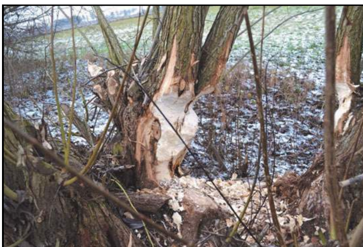
Niedokończone jeszcze dzieło bobrów, ale już niedługo ...