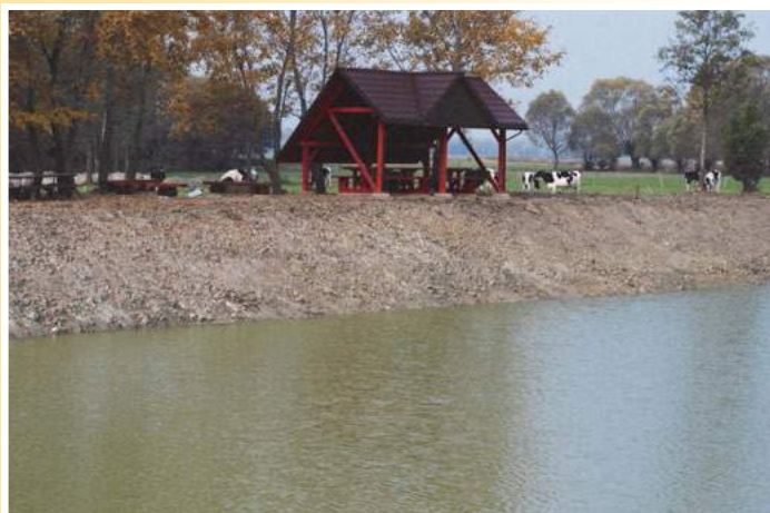
Nowa altanka i staw po renowacji w Dąbrowie Moczydłach