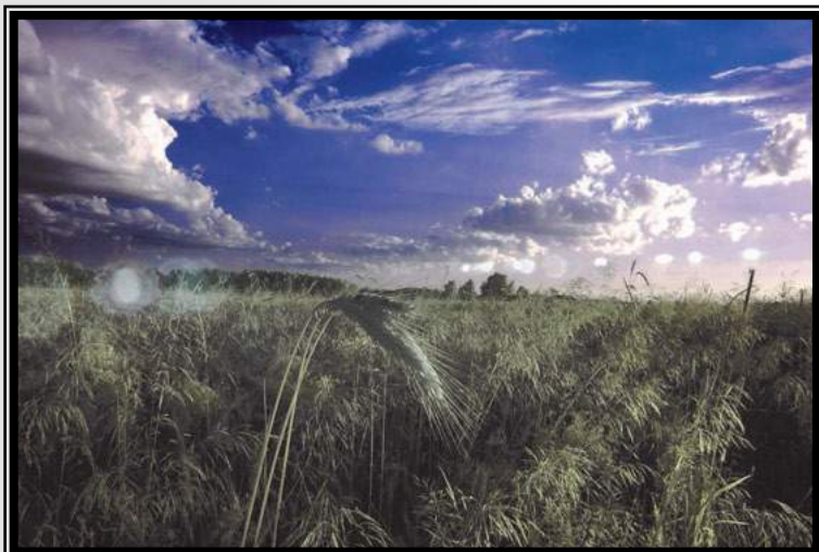
Wyróżnienie w konkursie „Podlaskie rolnictwo w obiektywie” - rok 2012