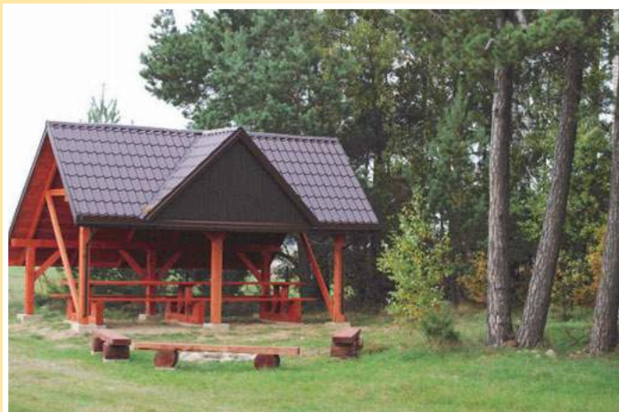
Altanka we wsi Kamień Rupie