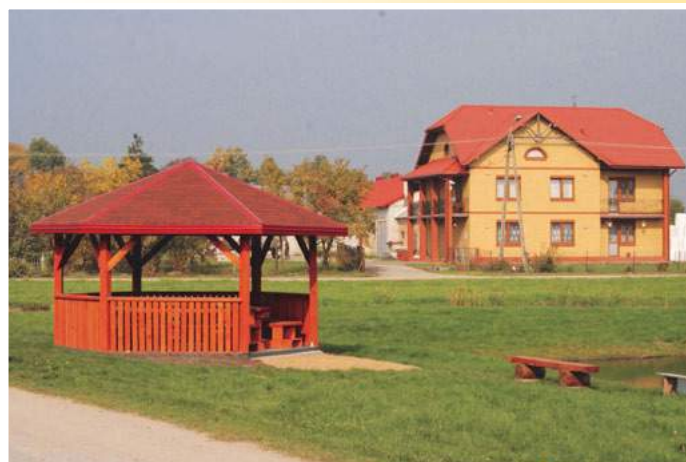
Zagospodarowane centrum wsi Szepietowo Żaki