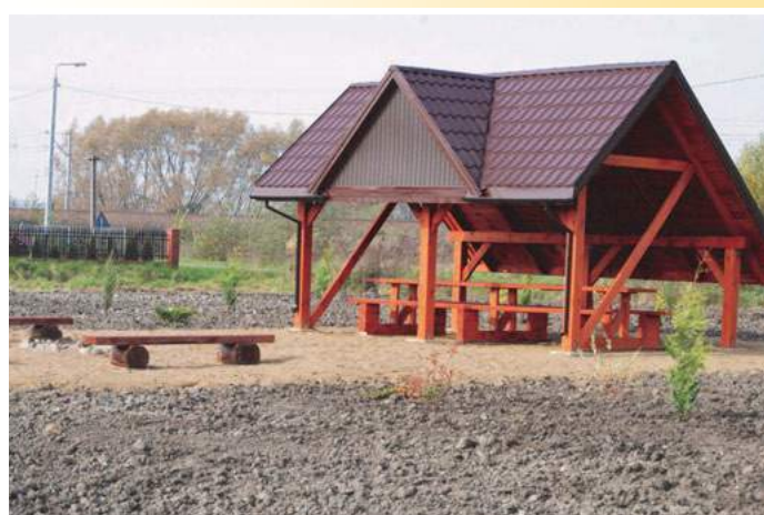
Altanka w Szepietowie Janówce