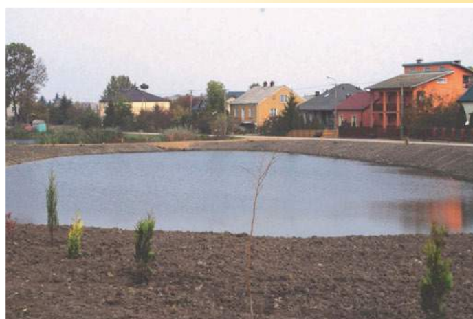
Szepietowo Janówka – staw po renowacji