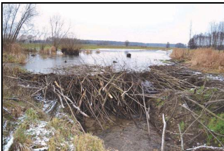
Zrobiona przez bobry tama spiętrza wodę na Miance na ponad 1 m wysokości, powodując już coraz większe zalewanie łąk.

Zdjęcia wykonane w dniu 3 XII 2013 r. na rzece Mianka w okolicy Dąbrówki Kościelnej: