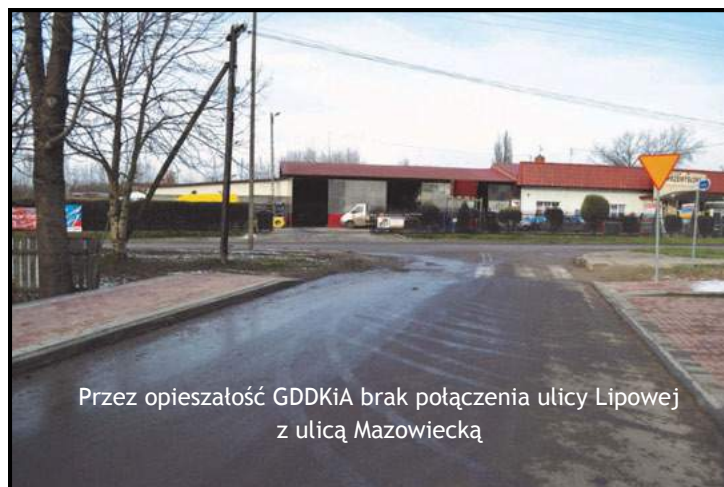
Przez opieszałość GDDKiA brak połączenia ulicy Lipowej z ulicą Mazowiecką