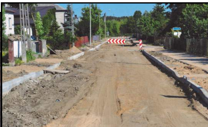
Ulica Witosa w trakcie budowy