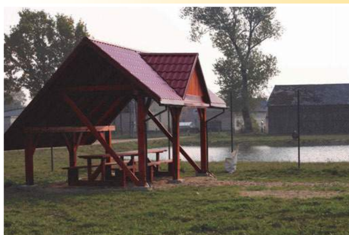
Altanka i staw w Dąbrowie Dołęgach