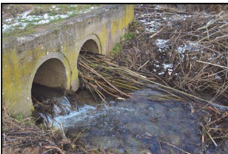
Przepust na drodze w ograniczeniu geodezyjnym Stare Gieratty. Co 3 dni przepust jest oczyszczany, ale bobry nie dają jednak za wygraną.