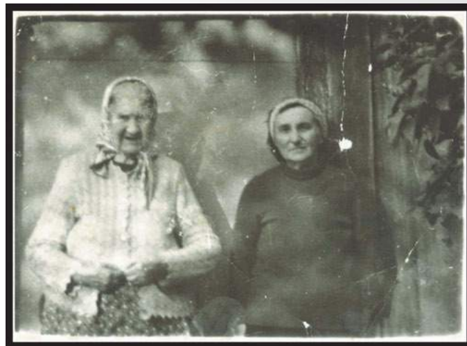
Jedno z pierwszych moich zdjęć aparatem AMI