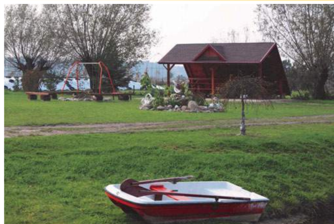
Teren rekreacyjny w Szepietowie Podleśnym

Do 2020 roku na trasie Warszawa - Białystok mamy zacząć jeździć z prędkością 160 km/godz. Wynika to z Wieloletniego Programu Inwestycji Kolejowych. „Przyspieszenie” na kolei wynika z decyzji Parlamentu Europejskiego zatwierdzającego plan budowy europejskich sieci korytarzy transportowych. W Polsce